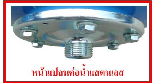
หน้าแปลนต่อน้ำสแตนเลส